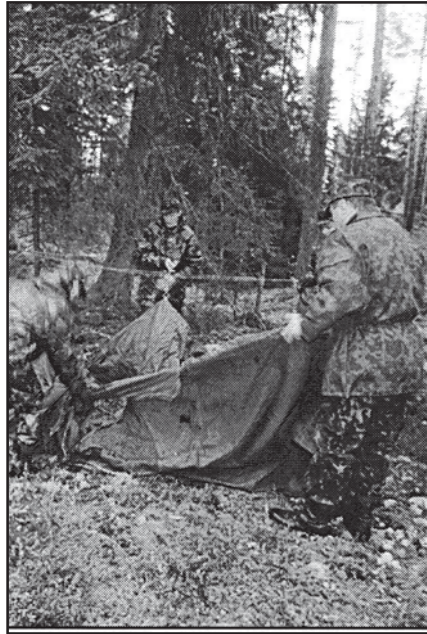
Juhtimispunkti metsa all töökorda seadmine nõuab staabiolbrüseridelt kogemusi ja treeningut.

- tähtis on suurte asustatud punktide kaitsmine, sest see võimaldab (nagu näitab Tšetšeenia sõja kogemus)