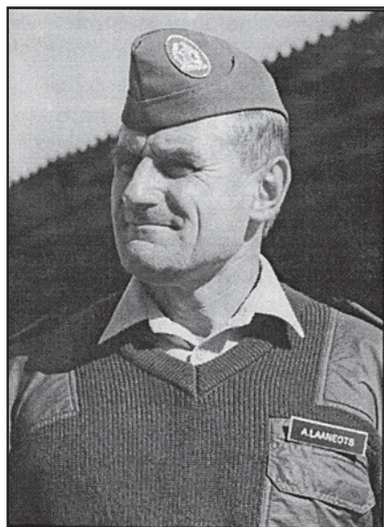
Kindralmajor Ants Laaneots: "Kui eesti mees vihaselt saab, annab ta lahingus silmad ette ka tšeeenile."

Kaitseringkond (KRRK) on iseseisvateks operatsioonideks võimeline, mitmetest kaitsepiirkondadest (KPK) ja erinevate väeliikide üksus-