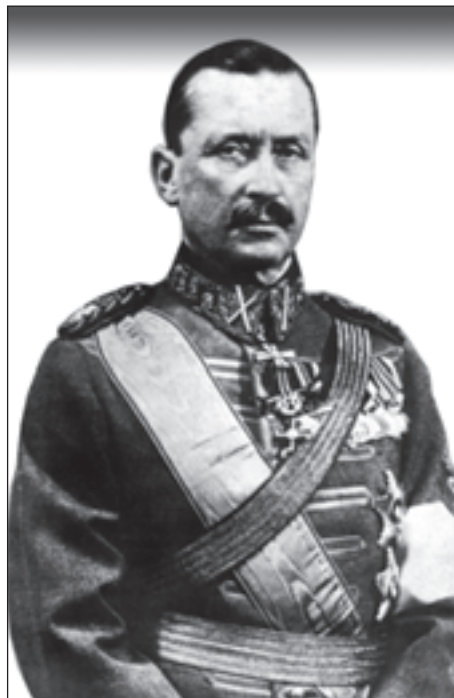
Soome vägede ülemjuhataja marssal Carl Gustaf Emil Mannerheim.

23. augustil 1939 sõlmisid Saksamaa ja NSV Liit nn Molotovi-Ribbentropi pakti, mis kujunes Teise maailmasõja avataktiks. Selle leppe salajase lisaga jaotati kaks imperialistlikku kiskjat Euroopa oma mõjusfäärideks. Saksamaa andis Stalinile Soome, Balti riigid