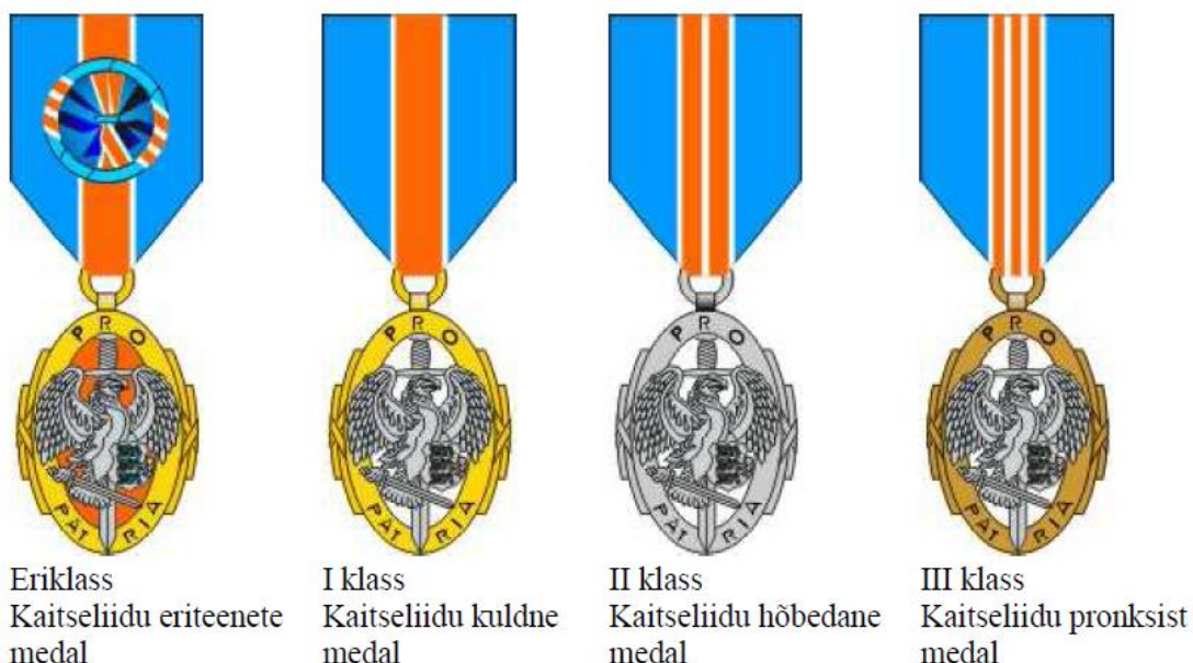
Joonis 1: Kaitseliidu teenetemedal

(2) Teenetemedali kolme põhiklassi medalid on ažuursed, eriklassi teenetemedalil on embleemi taust ning vapilõvid kaetud vastavalt oranži ja sinise emailiga. Ülevalt alla suunatud mõõk ja embleem on valmistatud hõbedast ning oksüdeeritud. Ornamentaalsete kaunistustega ovaal on III klassil pronksivärvi, II klassil hõbedane, I klassil ja eriklassil kuldne. Deviis PRO PATRIA on kõikide klasside medalitel oksüdeeritud tumedaks.