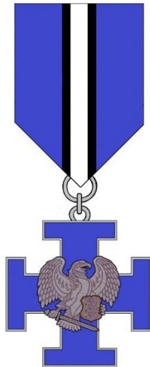
Joonis 1: Mälestusrist „Kaitseliidu taastaja“

Mälestusristi kuju viitab Vabaduse Ristile ja märgib sellega Kaitseliidu taastamise erilist tähtsust Eesti Vabariigi iseseisvuse taastamisel. Mälestusristi värvid osutavad Eesti rahvusvärvidele, Kaitseliidu taastajaid innustanud isamaa-armastusele.