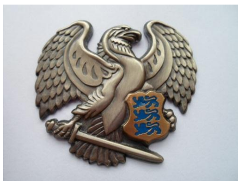
Foto 1. Kaitseliidu baretimärk

Kaitseliidu baretimärgiks on Kaitseliidu vapikotkas. Hõbedasest metallist märgi kõrgus on 40 mm ja laius 45 mm.